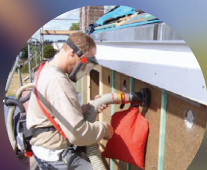
BINNEN- EN BUITENISOLATIE