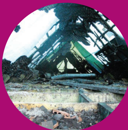
Vóór en na brand

Vóór de brand: cellulose-isolatie tussen balken van de zoldervloer - Na de brand: na weghalen van cellulose bleek dat balken intact waren gebleven.